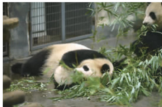
7月19日，长沙生态动物园，因近期持续高温天气，该园开启高温防暑模式，为园内3000余只动物消暑降温。