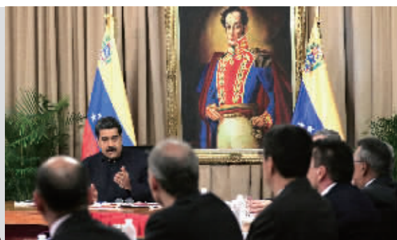
18日,委内瑞拉总统马杜罗出席国防委员会会议。