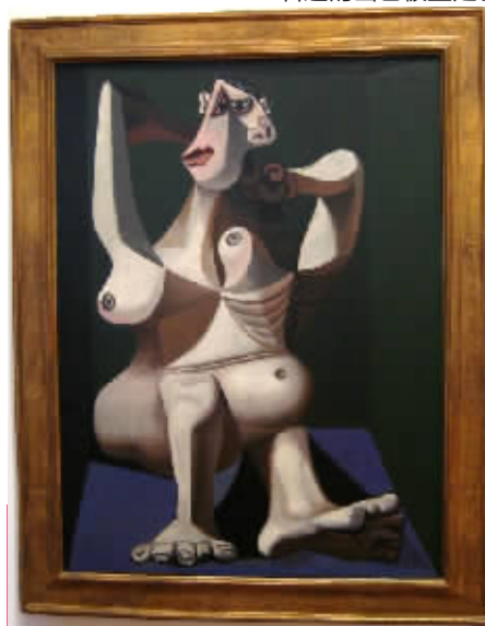
毕加索《长发披肩的女人》。