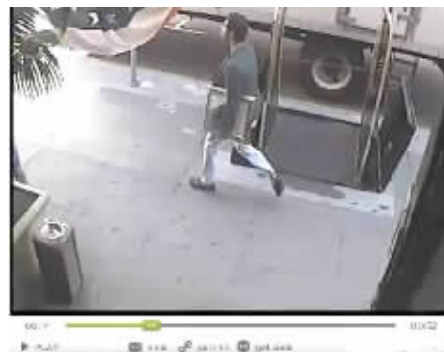
就是这么明目张胆地偷画。

“偷画的指令通过中转了无数级的线人来传达，可能同一幅画有20拨贼接到活，所以就算一拨人失败了也无所谓。这些人拿佣金办事，通常是数千到数万英镑不等。他们并不清楚这些艺术品的珍贵，所以我们最大的担忧是，在这个过程中艺术品很可能遭到不可挽回的损害。被监控录到的一些偷画的蠢贼，他们就这样明目张胆地偷。在得手后警方也不敢大张旗鼓追踪，任何过激的行为都有可能让这些画毁于一旦。”FBI的艺术品犯罪调查专家克拉克·埃利斯说道。