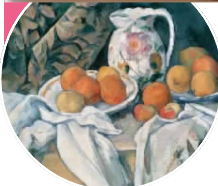
尚赛《壶和水果静物》。