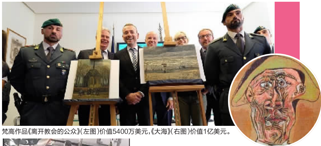
梵高作品《离开教会的公众》(左图)价值5400万美元,《大海》(右图)价值1亿美元。

电影《偷天陷阱》描述了一个关于盗取世界名画的计中计故事，其中高超的偷盗手法令人眼花缭乱。而现实生活中，偷画的并不是肖恩·康纳利在《偷天陷阱》里扮演的那种迷人绅士，而是一些胆大包天的街头蠢贼，他们用简单粗暴的方式偷来价值连城的油画，且绝大部分油画进入了毒品市场。