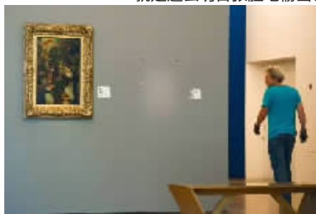
右边的画已被盗走。