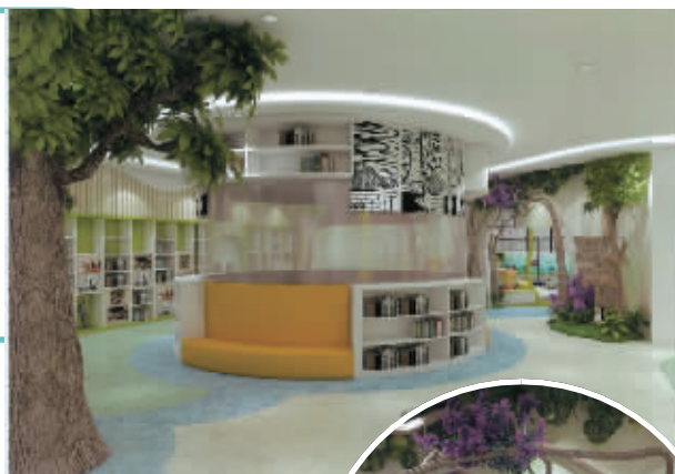
省少儿图书馆升级改造后的效果图。