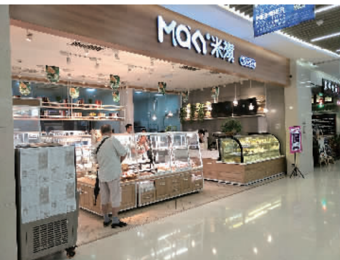
7月9日下午，米旗华创国际广场店摆出了致会员退卡须知。