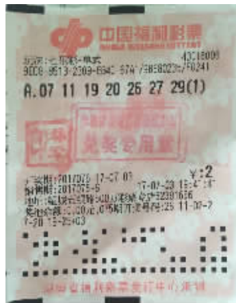
李先生的中奖彩票。

7月3日，中国福利彩票七乐彩第2017076期开奖，当期开出基本号码为07、11、19、20、26、27、29，特别号码为08。全国共中出一等奖2注，单注奖金66万余元。来自我省长沙市望城区五银路第43018009号站点的彩民幸运中得一等奖1注。