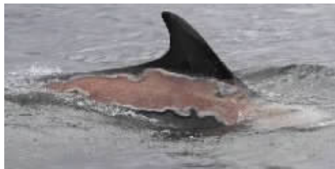
这只宽吻海豚因为搁浅而被严重晒伤。