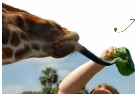
长颈鹿的舌头前后颜色不一样，前段深色可以防晒。