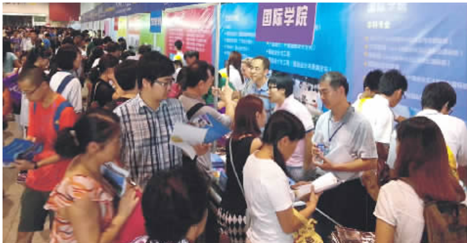
历年的高校招生咨询场面都非常火爆。(资料图片)