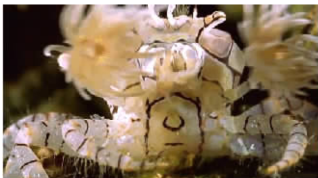
拳击手蟹用扎人的海葵当防御武器。