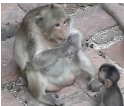
小猕猴跟着妈妈学怎么用人类头发当牙线。