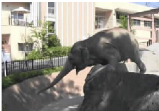
大象用鼻子吹玩具。

拳击手蟹会挥舞着扎人的海葵当防御武器。美洲短吻鳄会在鼻子上摆上树枝，引诱需要树枝筑巢的白鹭。马岛鸚鵡还会用鹅卵石磨贝壳制造钙粉，为自己造补品补充营养。白兀鷺用石头把鸵鸟的蛋敲碎。白兀鷺的小鸟虽然叼不起石头，但会用小石头、木头或者便便来砸鸟蛋。