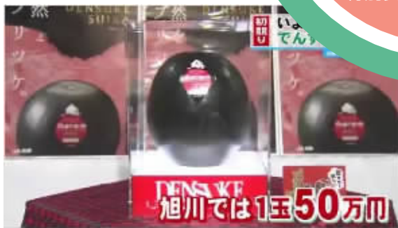
50万日元一个的西瓜。

但在日本,更多人是买一片回家,到家后再细切一小片一小片,别问为什么,大家都知道日本的西瓜特别贵特别贵!