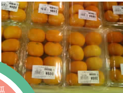
一盒橘子要48.7元人民币。