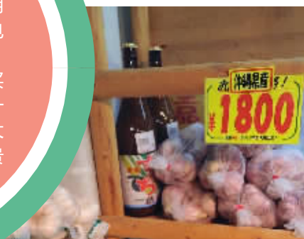
冲绳产的大蒜1公斤要129块钱。

炎炎夏日到来,西瓜是必吃的水果之一,很受人们的喜爱。抱着半个西瓜,用勺刮着吃,吹着空调看着电视,别提有多爽。