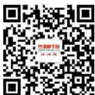
关注三湘都市报微信 看E报。