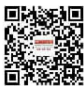
三湘都市报微信公众号

请记住我们的联系方式: 热线:15616170102 微信:三湘都市报微信公众号(ID:sxdsb96258) 微博:三湘都市报