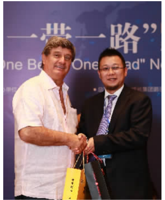
刘健(右)与秘鲁前第一副总统劳尔·迪斯·坎塞科·特里(左)

5月14日-15日,全球镜头聚焦中国,29位国家元首和政府首脑齐聚北京,举行“一带一路”国际合作高峰论坛,达成了共76大项、270多项具体成果。