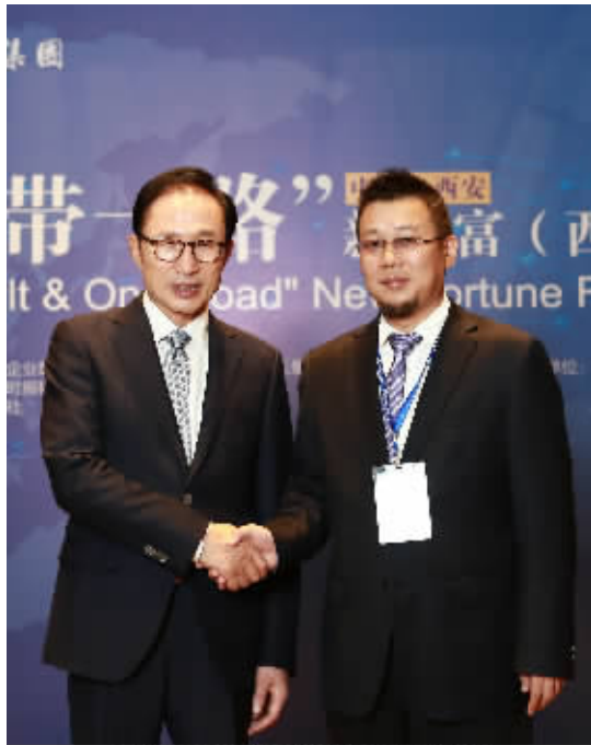
刘健(右)与韩国前总统李明博(左)