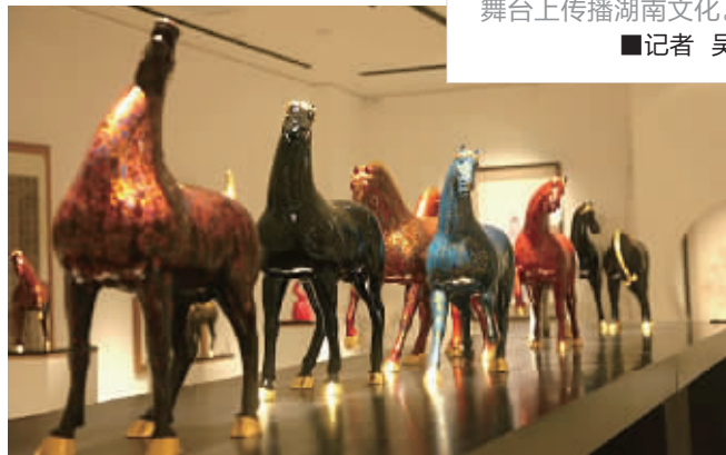
大赛获奖作品“大彩·九华驹”。