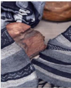
大赛金奖作品“梭说侗锦亚麻系列”。