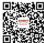
三湘都市报微信公众号

请记住我们的联系方式： 热线：84329225 微信：三湘都市报微信公众号 (ID:sxdsb96258) 微博：三湘都市报