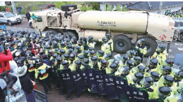
4月26日，在韩国庆尚北道星州郡，“萨德”反导系统部分装备在警察的护卫下陆续运往“萨德”系统部署地星州高尔夫球场。