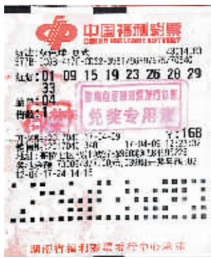
易先生的中奖彩票。

整晚失眠的易先生并没有想好奖金的规划,工作数年来,他早已习惯现有的生活节奏,所以兑奖后的易先生打算先有始有终地做好本职工作,等一切都想清楚了,再动用这份上天赐予的大礼。 ■木子