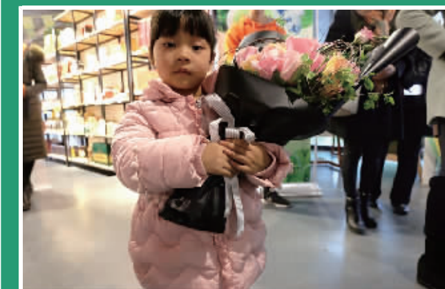
小朋友抱着自己插的花。