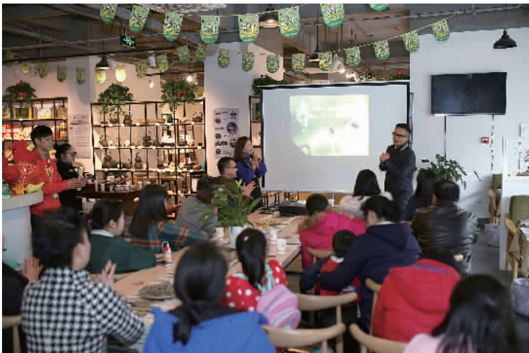
大茶网体验店小儿推拿活动现场。