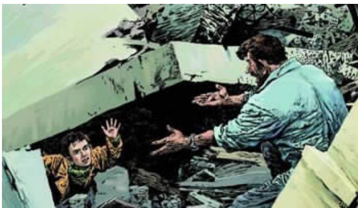
五年级上册的《地震中的父子》。

“我们不可能编出完美的教材。”北京教科院基础教育研究中心教研员连中国老师说,“发现了不对的地方,咱们就改。”但是课文中的一些内容可能会牵扯到历史深处的东西,一些问题可能不仅涉及语文一个学科。改不改、怎么改,要由专业的机构、权威的专家经过反复地、谨慎的考证。