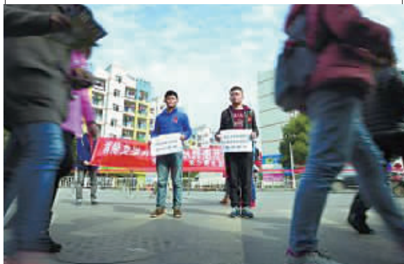
艾滋病感染者在街头征集拥抱,期待不被歧视。

此次活动的两名参与者均是大学生,不管是被感染的学生还是没有被感染的学生,他们在生活、学习以及将来毕业了参加工作上,都是和大家一样的。艾滋病仅仅是一种疾病而已。罗丹教授也呼吁社会各界不要歧视艾滋病病人,艾滋病病毒才是我们共同的敌人。