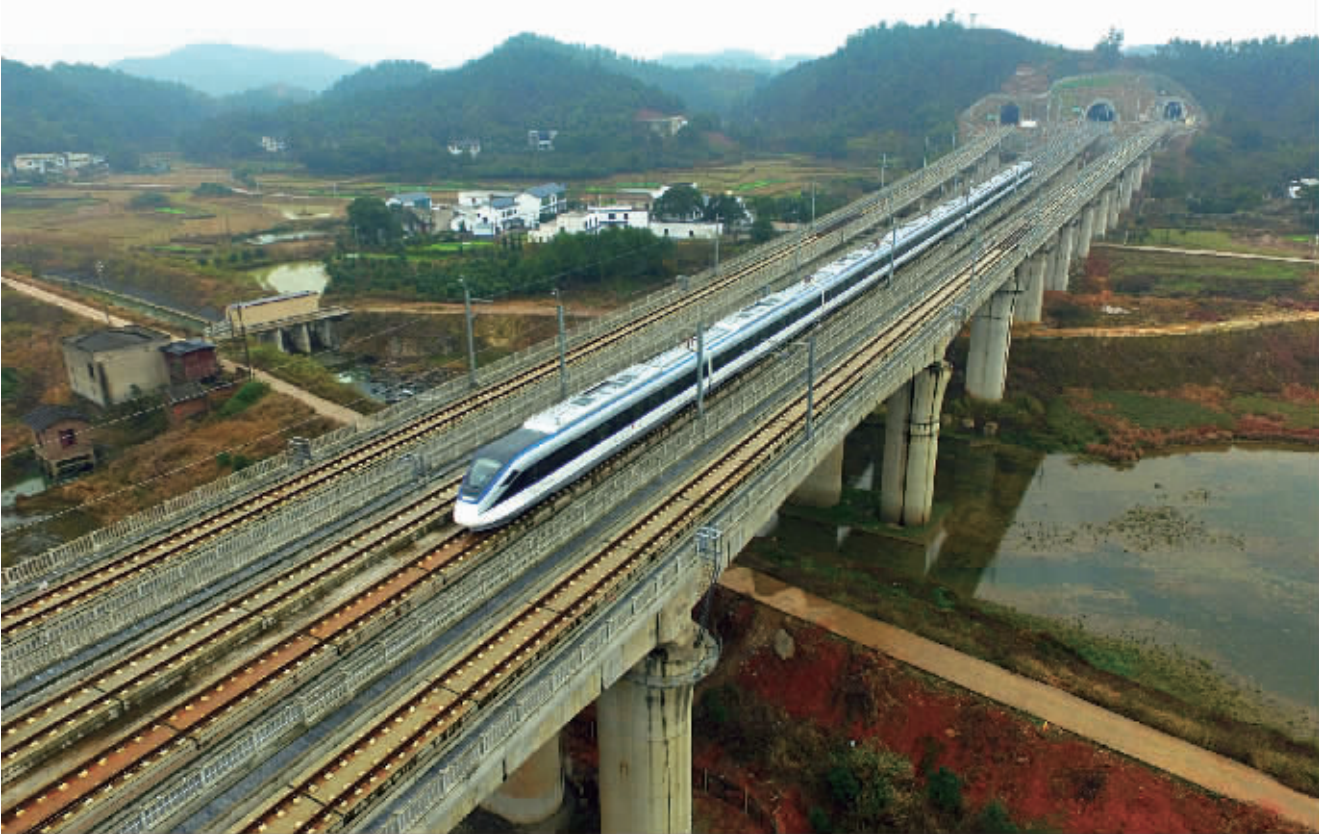
2016年12月26日上午,长株潭城际铁长沙暮云段,一辆列车穿过隧道驶向暮云站。当天,长株潭城际铁路正式开通运营。