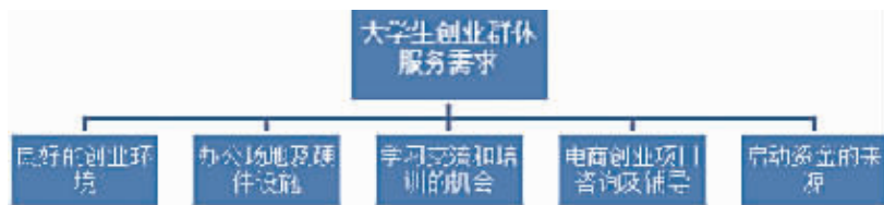
大学生创业群体服务要求

在省人大常委会副主任谢勇看来,青年电商创业的问题,归根结底就是一缺资金、二缺政策、三缺人才。他指出,各级各部门要充分把握中央和省里支持青年创新创业和扶持小微企业发展的政策机遇,积极整合政策、资金、信息、市场资源,形成共同关心支持青年创新创业的工作合力,为青年创新创业提供服务。要全面了解青年创新创业领域的扶持政策,以简单明了、对路管用的方式整理公示出来,让青年创业者一看就懂,让负责政策落实的部门一清二楚,实现政策有效运行。要统筹各方力量,广泛调动政府相关部门、金融机构和社会组织的积极性,通过相应的体系制度设计,着力推动青年电商创业向各个产业领域延伸,推动我省电子商务上台阶、上水平。