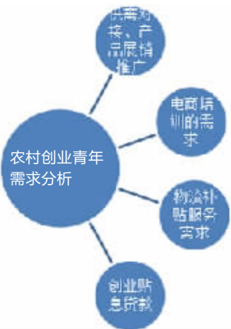
农村创业青年群体服务要求