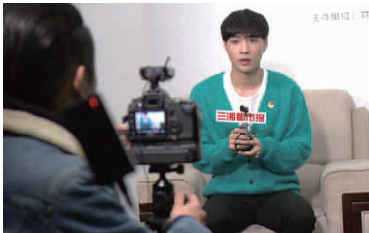
「长沙小骄傲」张艺兴送新年祝福。