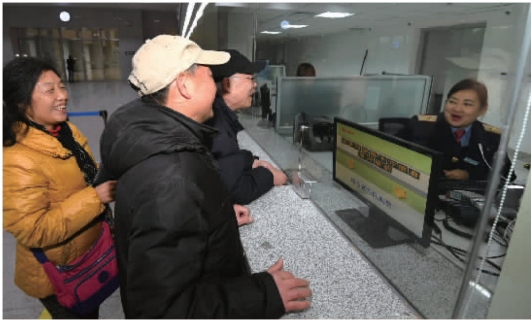
12月25日下午,长株潭城铁长沙站售票厅,市民提前购买城铁车票,准备体验乘坐长株潭城铁列车。目前,长株潭城铁静态验收、试运行都已完成,定于今日正式开通。