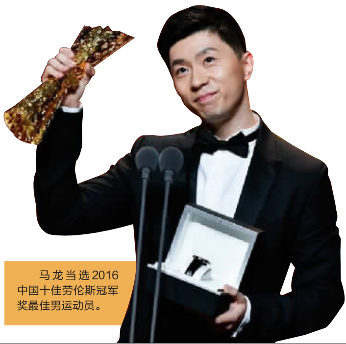
马龙当选2016中国十佳劳伦斯冠军奖最佳男运动员。