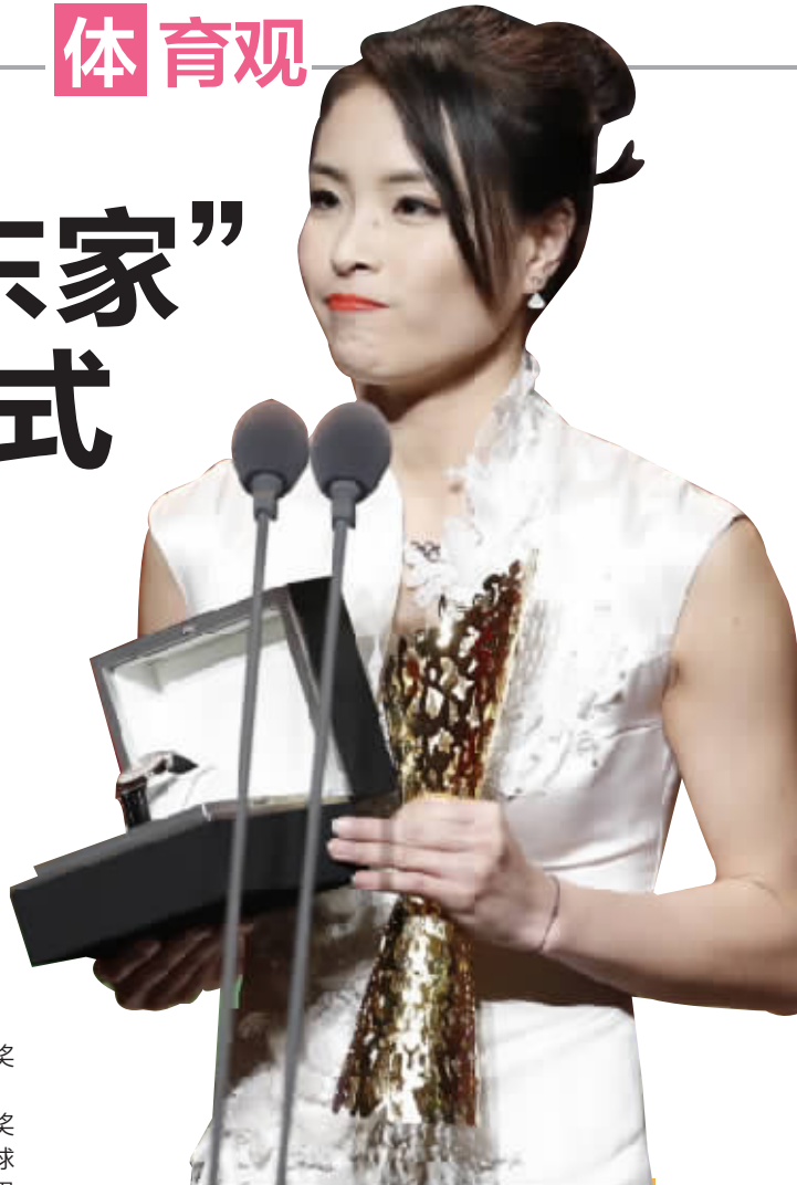
吴敏霞当选2016中国十佳劳伦斯冠军奖最佳女运动员。

2011-2015年,十佳劳伦斯奖再度停办。不过,十佳劳伦斯奖在国内具有很大的影响力,虽然2011年之后停办,但其相关的慈善活动却一直延续下来。