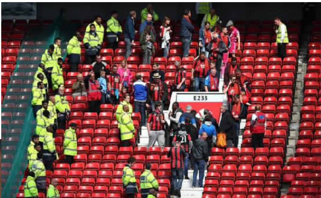
遭遇炸弹威胁，球迷撤离球场。

该媒体称，这次事件足以让老特拉福德的管理人员“脸红”。然而出现这样的“乌龙”，老特拉福德早已不是第一次了，红魔主场有过“假炸弹”，甚至还成了老鼠的乐园。