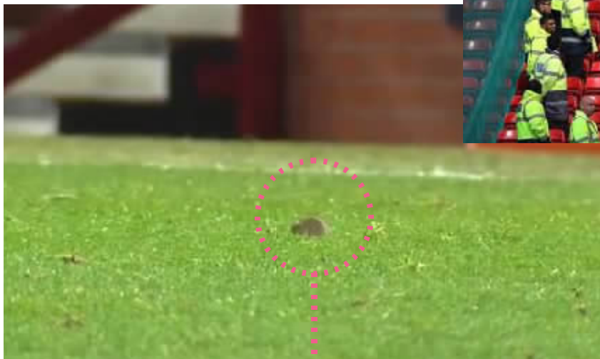
▲老鼠乱入曼联VS南安普顿的比赛。