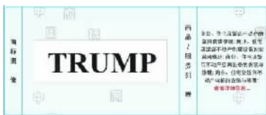
特朗普申请的“TRUMP”商标