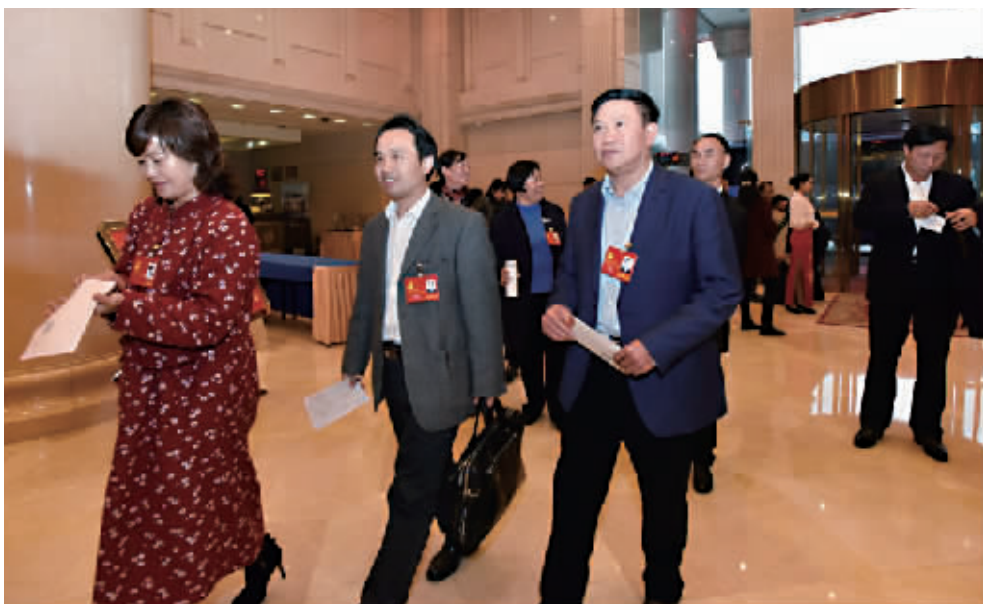
11月13日,出席省第十一次党代会的代表陆续抵达长沙。