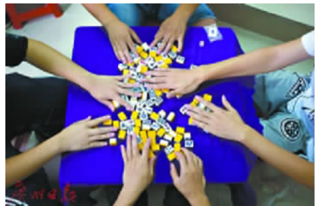
教室里正在举行竞技麻将比赛；一局结束，裁判就用电脑记录下成绩。