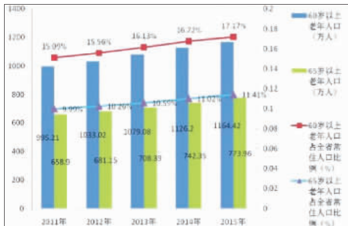
“十二五”期间我省老年人口增长情况。

目前,省老龄委相关部门结合各自职责,已先后印发了30多个涉老政策文件,为发展老龄事业、维护老年人合法权益提供了强有力的保障。