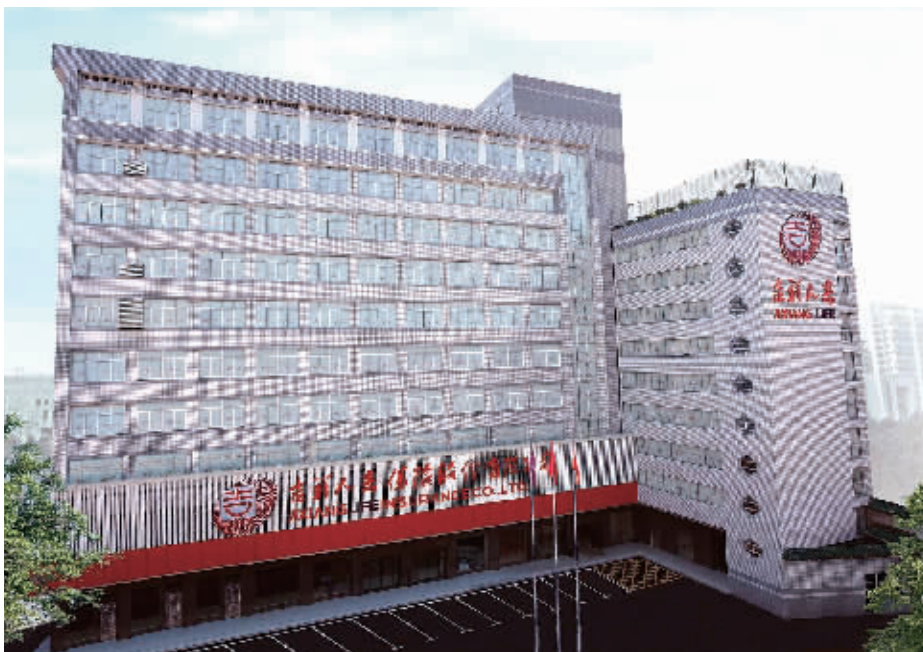
吉祥人寿连续三个季度获中国保监会A类风险综合评级。