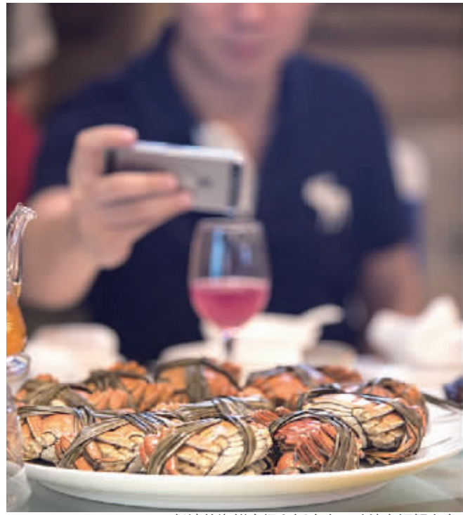
长沙的海鲜市场和饭店内已陆续有闸蟹上市。

9月13日,记者在老长沙龙虾馆看到,该店推出了蒸蟹、蟹头、蒜蓉蟹以及蟹脚等多种新