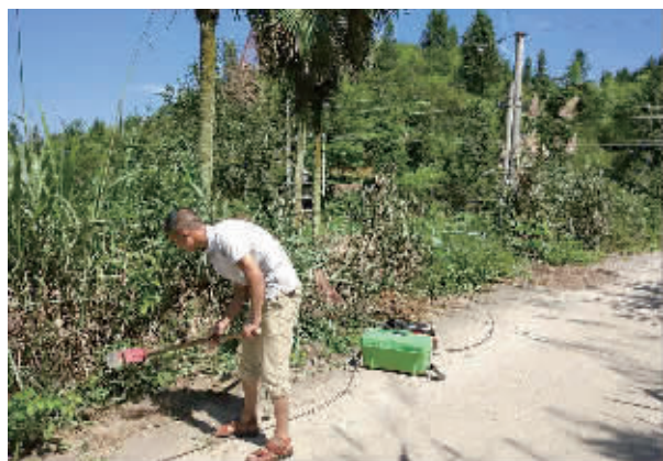
维护人员在高温下开展故障抢修。

湖南移动提醒广大用户：这正是利用相关软件和伪基站冒充10086给市民发送的诈骗短信，他们通过钓鱼网址来骗取市民的身份证号、手机号、银行账号等个人信息，从而窃取存款。10086不会重复收取话费，更不会让客户点击链接领取话费。遇到不明链接不要点击，切勿轻易输入银行账号和密码，谨防个人信息泄露。