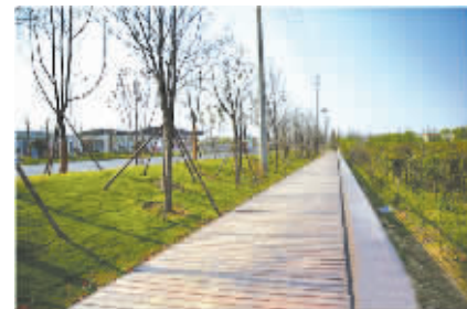
银城大道生态走廊，美不胜收