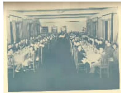
交大1934届毕业聚餐合影。