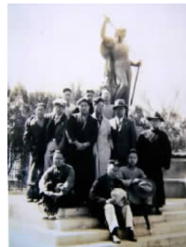
1934届毕业旅行实习合影。

纪念刊、散伙饭、毕业照……这些其实民国大学基本都有，因为当时的大学在制度、课程、仪式方面都学习西方大学做法。但有一样属于交大特色，那就是毕业旅行。因为交大隶属于铁道部。有铁道部的支持，校方可以申请专列用于毕业旅行考察，沿着铁路线，遍行大江南北。这是绝大多数隶属教育部的大学办不到的。