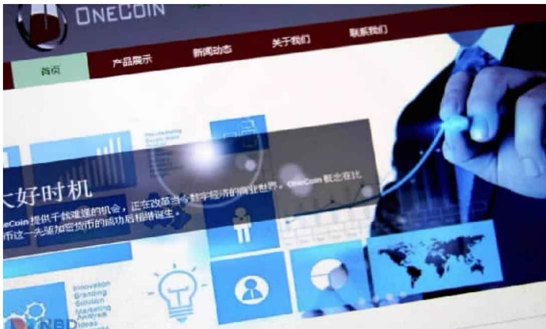
5月30日，广东中山市公安局对外发布称，中山东区警方成功破获一起“维卡币”传销案。