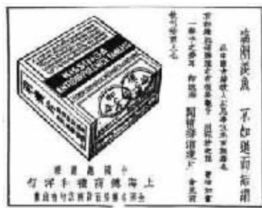
德国礼和消瘦片的广告:宛若游龙,丰神如画。

民国时期,大家对洋货的推崇更是有增无减,进口到中国的商品也越来越多,香烟、胶卷、皂粉、牙膏,甚至还有进口的减肥药。