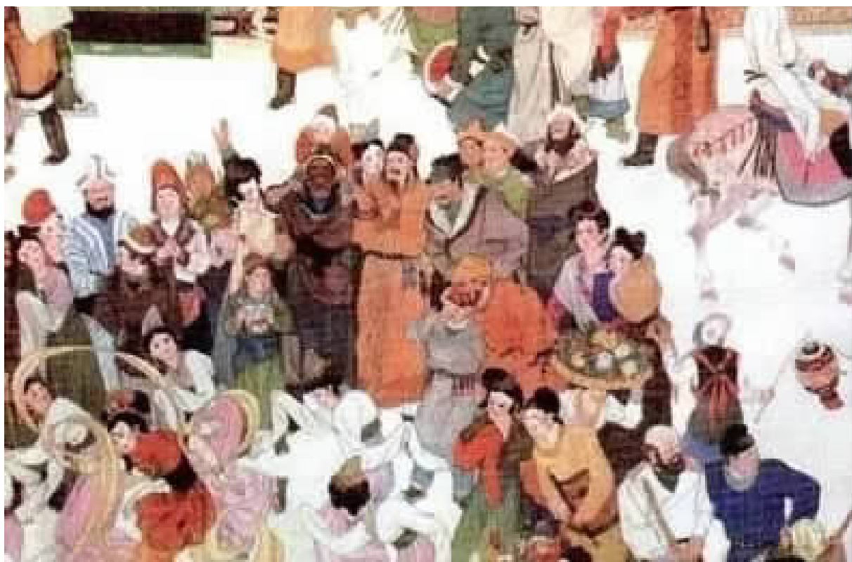
长安西市的景象,街边人的穿戴能看到很多异域元素。当时的长安市分东市和西市,西市的外国人和外国商铺比较多。