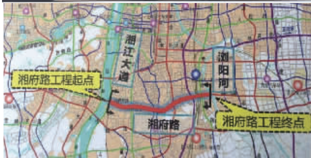
▲湘府路快速化改造效果图。

继万家丽路快速化改造后,长沙又将在年内启动湘府路快速化改造,这是长沙市城乡规划局5月24日发布的消息。湘府路快速化改造西起新开铺路、东至浏阳河边,全长11.87公里,主线为双向六车道宽。