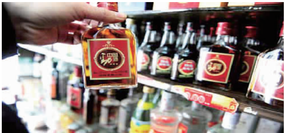
超市在售的保健酒。

实惠是什么？首当其冲是价格。在观察中，保健酒企业基本没有将诉求放在饮用者的身份等级上，而是一直以低姿态亲民，以普通消费者可以接受的价格去面市。保健酒在白酒市场下滑中屡屡逆袭，并逐渐扩大了消费市场。实惠两个字真实地反映了目前市场上保健酒的价格和价值，广大消费者的事实购买和经常饮用证明了保健酒的真实价值在那里。