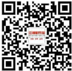
关注三湘都市报微信看E报。