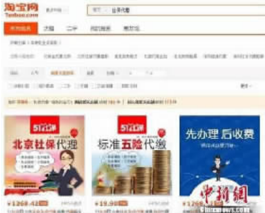
淘宝网上可以搜索到上百家代缴社保的店铺。