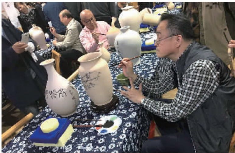
文人书法家在陶瓷上作画。

本报5月10日讯 千年古镇，十里陶城。长沙望城铜官古镇是世界釉下多彩的发源地。5月9日，首届书堂山当代文人书法周在望城举行，原国家文化部部长王蒙、中国作家书院院长王巨才等大师在铜官创作陶瓷收藏壶，实现陶艺与书法的完美融合。