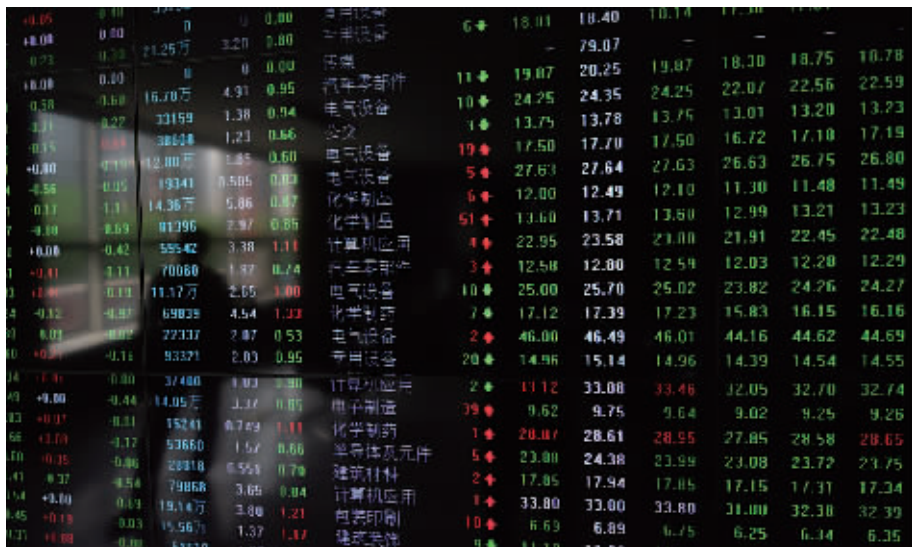
一家证券营业部的电子显示屏。当日，上证综指报收于2832.11点，跌幅为2.79%。

随着期货市场的暴跌，A股市场的相关股票也随之暴跌，钛白粉、煤炭、钢铁、有色等板块成了直接将大盘拉下马的“祸水”。