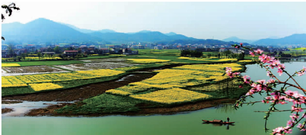
桃花江是桃江境内的一条溪流、资水支流。20世纪30年代，著名音乐家黎锦晖一曲《桃花江是美人窝》唱红了桃江。