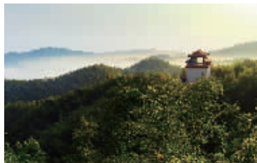
桃江竹海。

将优质高粱酒浆注入活竹内，自然生长，天然密封，饱吸竹子精华，生长数月，酿成人间美酒。酒色酒体金黄碧翠，色如琥珀，晶莹剔透；酒香酒质芬香浓郁，竹香优雅，香飘四溢；酒味醇香甘甜，竹汁清香，口感独特。