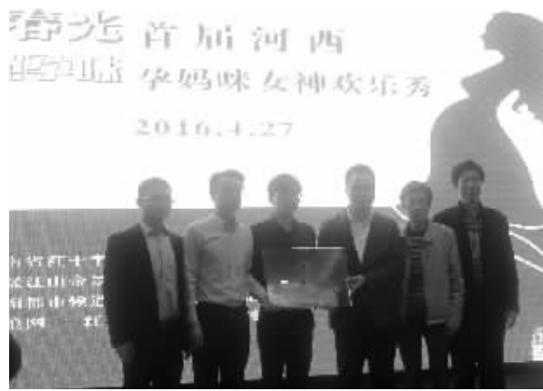
孕妈咪女神欢乐秀活动现场。

活动现场,200多对家庭与主办方一起共同见证了《红粉俱乐部》河西沙龙落户江山帝景华天的历史瞬间,也将一同接受美食DIY的挑战,领略西点的时尚美味,体验面点的传承魅力,以一片水饺包裹智慧,用一抹奶油点缀生活。