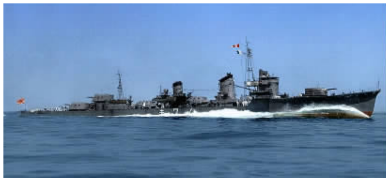
“野分”号是日本阳炎级驱逐舰的第15号。

“武藏”号是最倒霉的，莱特湾海战时，左边是“雪风”右边是“野分”，就算超级战列舰也没用了。