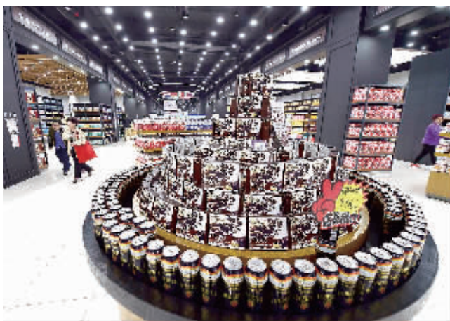
市民在天津自贸区跨境商品直营中心内挑选商品。

普通消费者来说是直接利好。不过记者发现，不少跨境平台推出的优惠都有期限，通常在一周左右时间，消费者想买便宜要趁早。