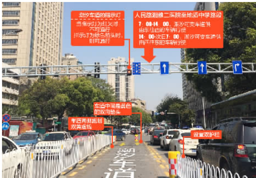
长沙人民路潮汐车道现场。 ■制图/杨诚