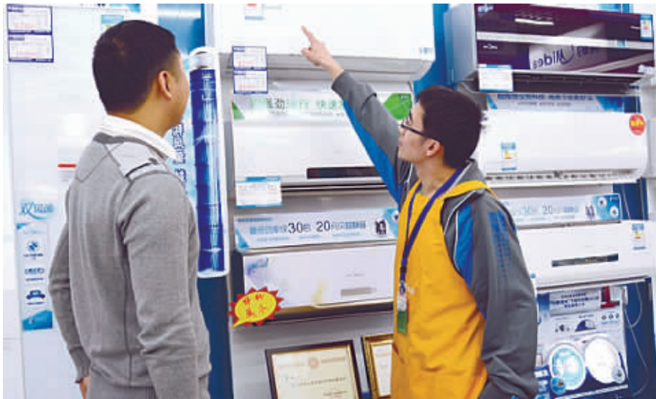
受经济波动及客观天气等因素影响，中国空调市场整体表现低迷。

2015年，受宏观经济发展放缓、房地产市场波动及客观天气等因素影响，中国空调市场整体表现低迷。2月23日，苏宁中怡康联合发布《2016年中国空调行业白皮书》显示，2015年中国空调市场整体零售额为1374亿元，同比下降4.8%；整体零售销量为4170万台，同比下滑1.1%。截至2015年底，行业库存总量已经突破4000万台，相当于国内空调一年销售总和。《白皮书》认为，空调行业2016年依然面临大考。