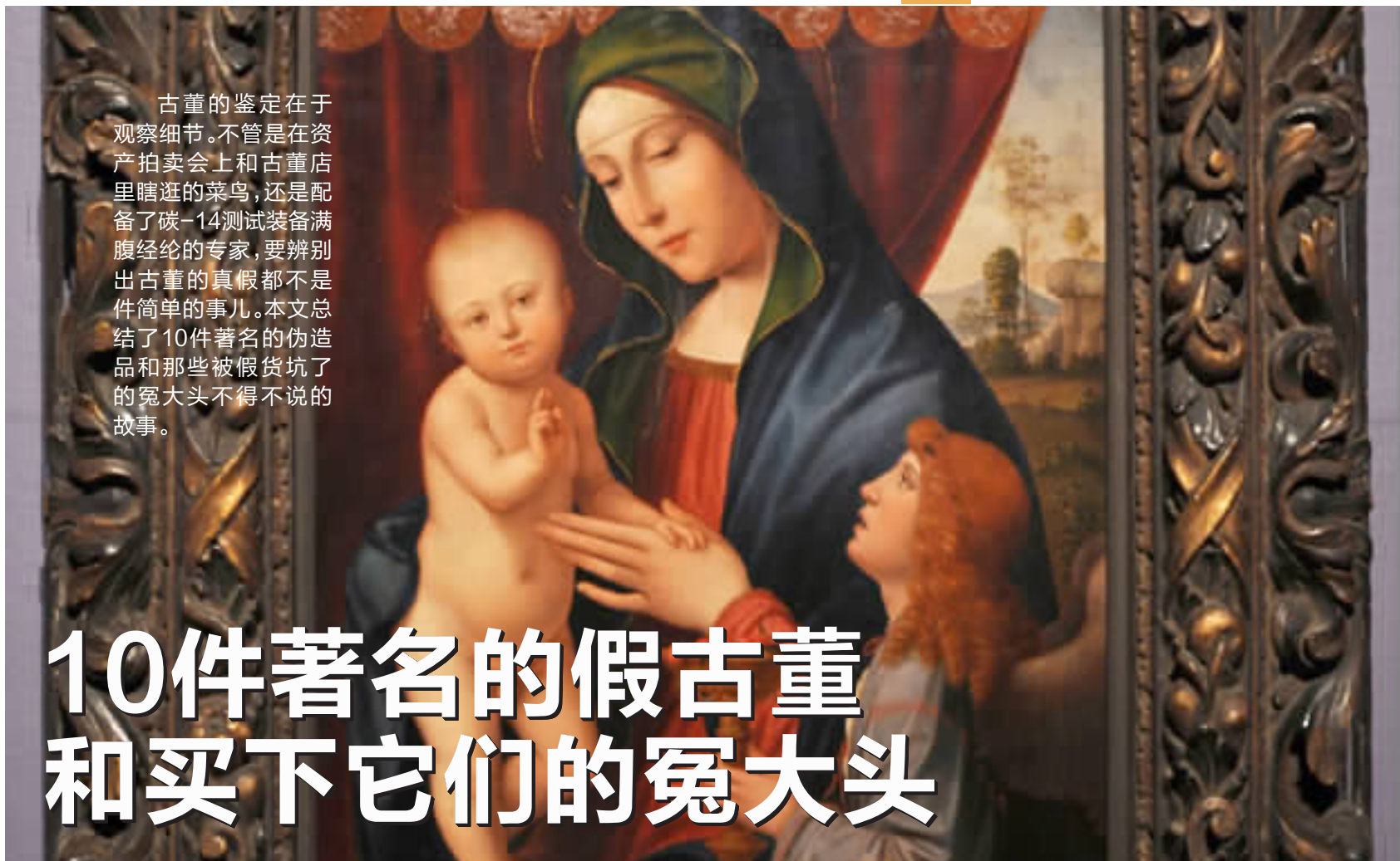
图为伪造的《圣母圣子与天使》。

古董的鉴定在于观察细节。不管是在资产拍卖会上和古董店里瞎逛的菜鸟，还是配备了碳-14测试装备满腹经纶的专家，要辨别出古董的真假都不是件简单的事儿。本文总结了10件著名的伪造品和那些被假货坑了的冤大头不得不说的故事。