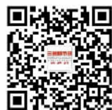
三湘都市报微信号 “轻报纸”看E报。