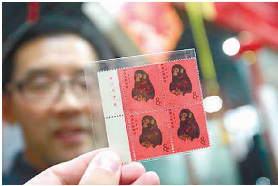
1980年的猴票是我国发行的第一张生肖邮票,如今已身价暴涨。

而“猴大版”市价可能在200元左右,长期看升值潜力比较大。此外,现在不少机构发行金银贵金属邮票,都属于猴票的衍生品,但投资价值远远小于“猴大版”。